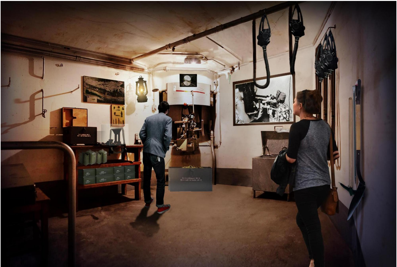
Fort de Chillon